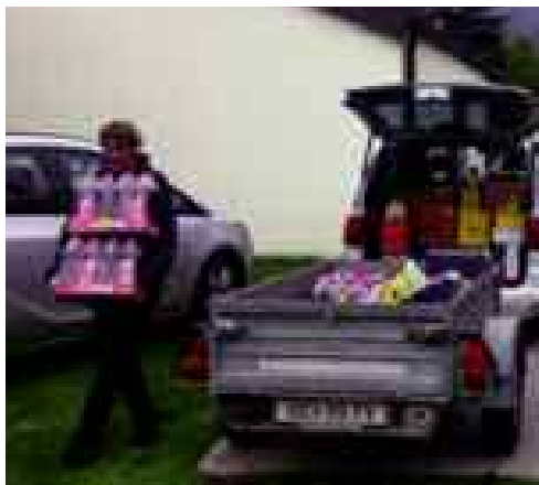
Pfarrquelle Aktivisten der Pfarrei sammeln Lebensmittel für die Ausgabestelle für Bedürftige.

Dagegen können wir pro Jahr leider nur 20 bis 30 Gemeinde-Neueintritte durch Zuzug und angefragte Taufen verzeichnen. Wenn man nun die zahlreichen Kirchenaustritte dagegen