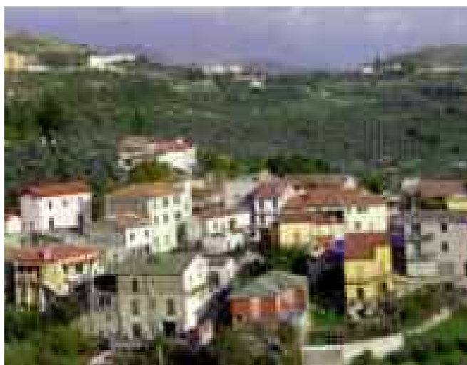
Klosterblick Acuto, das Städtchen, in dem Maria De Mattias die Anbetorinnen des Blutes Christi gegründet hat.