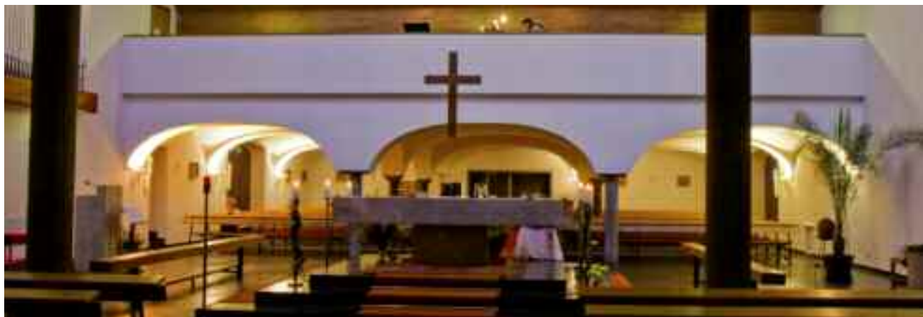
Mystisch Der Innenraum der Kirche lädt zum Verweilen ein.

Unsere Pfarre ist nun seit fast zwei Jahren auch ein Teil des auf dem Reißbrett errichteten Pfarrverband 3. Wir haben diese Seelsorgeeinheit zunächst als „Pfarrverband am Gaisberg“ getauft. Alle Pfarren unseres Pfarrverbandes verfügen derzeit noch über einen eigenen Seelsorger. Jedoch sind auf Zukunft für die Stadtpfarren Aigen, Parsch, Gnigl und Elsbethen nur zwei Priesterstellen vorgesehen. Hier können wir derzeit auch noch berechtigt auf Mithilfe von unserer benachbarten CPPS-Niederlassung, dem Kolleg St. Josef, hoffen. Zudem sind wir augenblicklich noch in der Lage, eine für städtische Verhält-