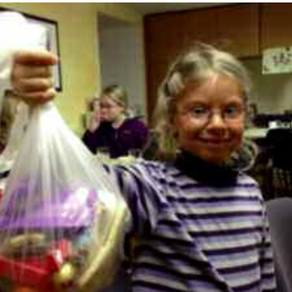
Integriert Den Kindern und Jugendlichen gilt in der Pfarre Parsch besondere Aufmerksamkeit.

nisse umfassende Seelsorge in unseren beiden auf dem Pfarrgebiet liegenden Altenheimen wahrzunehmen. Jährlich sind es circa 70 Menschen, die wir in ihrem letzten Lebensabschnitt und dem Übergang in ihre ewige Heimat mit unserm Gebet begleiten.