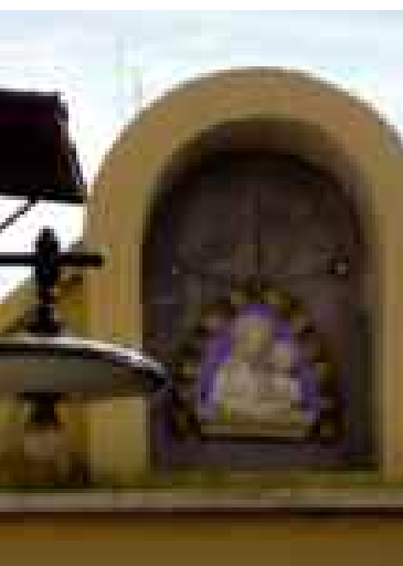
ung Dieses Bild sah schon die n Maria De Mattias.

Am Ende meines kleinen Reiseberichtes möchte mich bei allen ASC bedanken. In der Zwischenzeit arbeiten ja bereits über 2000 ASC in mehr als 26 Nationen und auf allen Kontinenten. Ich möchte mich bedanken für ihr mutiges Eintreten für ihre Nächsten in der Nachfolge der Maria De Mattias. Ganz besonders bedanken möchte ich mich bei den italienischen Schwestern, die mich so gastfreundlich aufgenommen haben sowie bei den Schaaner Schwestern, deren Begleitung in Mails, Telefonaten und Gebet stets spürbar nah war. Wer tiefer in die Spiritualität der Maria De Mattias hineinwachsen möchte, der sollte einmal an die Wurzeln, den Ursprung ihrer Geschichte, an die Quelle reisen. Die Quelle der Gründerin Maria De Mattias aber liegt in Italien, in schönen Acuto und in manchen anderen Orten, wo ich jetzt unterwegs bin ◀